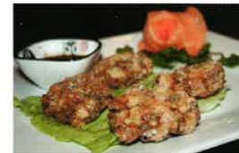
EBI KARAAGHE (69b)