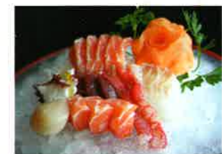
SASHIMI PICCOLO (43)