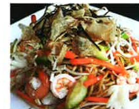
YAKI UDON SOBA (62)