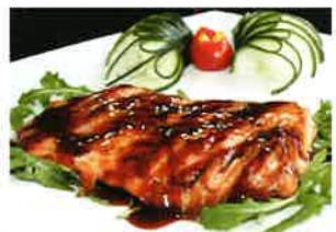
SAKE TERIYAKI (70)