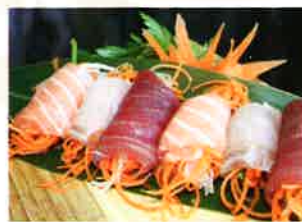
SASHIMI A ROTOLINI (43a)